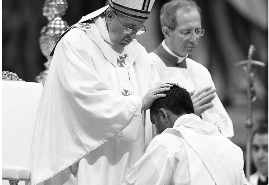
မြန်မာနိုင်ငံ ကက်သလစ်ဆရာတော်များ အဖွဲ့ချုပ်၊ လူထုဆက်သွယ်ရေးရုံး

စေခိုင်းရန်မဟုတ် အစေခံရန် လာခဲ့သော သိုးထိန်း၏ နမူနာကို အတုယူ ကြပါဟု မှာကြားကာ နိဂုံးချုပ်ခဲ့သည်။