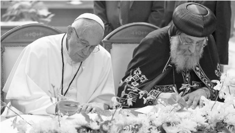
ပုပ်ရဟန်းမင်းကြီး ဖရန်စစ်နှင့် ကော့ပံတစ်ရဟန်းမင်းကြီး ဒုတိယမြောက် တွာဝါဒရော့စ် တို့ သဘောတူညီချက်ကို လက်မှတ်ထိုးနေကြစဉ်