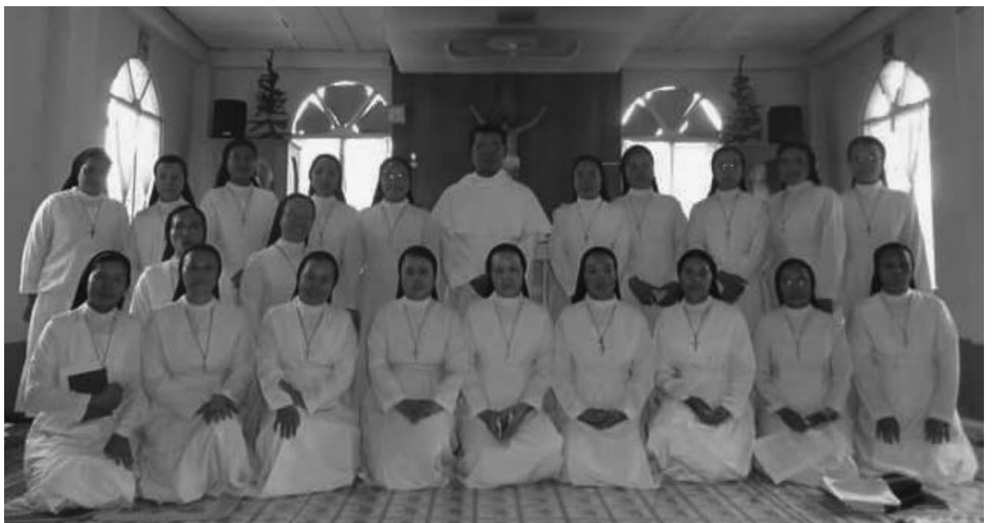
အမှုတော်ကိုထမ်းဆောင်ရန် ဆန္ဒရှိကြ အကျိုးကျေးဇူးများကို (၅)ရက်တိုင်တိုင် Soreh အားကျေးဇူးတင်ကြောင်း သိရှိရ ကြောင်းနှင့် သစ္စာသုံးပါး၏ ကြီးမြတ်သော ဖော်ကျူးပေးသွားသော ဖာသာရ် Philip သည်။ D.ဖန်(ZSLF)

သစ္စာသုံးပါးကို အခြေခံပြီး စိတ် သစ်၊ ကိုယ်သစ်၊ ဘဝသစ်ဖြင့် သာသန