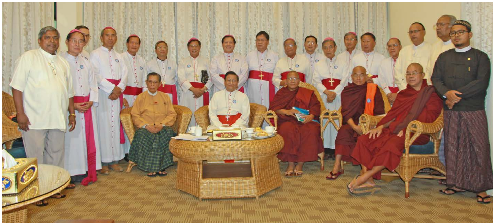
၂၀၁၇ ခုနှစ် ဧပြီလ ၂၆-၂၇ ရက်များတွင် ရန်ကုန်မြို့ရှိ International Business Center ၌ ကျင်းပပြုလုပ်ခဲ့သော ငြိမ်းချမ်းရေး ညီလာခံတွင် မြန်မာနိုင်ငံကက်သလစ် ဆရာတော်ကြီးများအား အမျိုးသား ဒီမိုကရေစီအဖွဲ့ချုပ်နာယက သူရဦးတင်ဦး၊ အခြား ဘာသာရေး ခေါင်းဆောင်များနှင့်အတူ တွေ့ရစဉ်