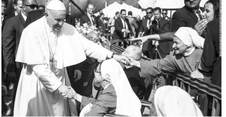
မစ္စားအပြီးတွင် ရဟန်းသီလရှင်များနှင့် သီးခြားတွေ့ဆုံကာ မျှော်လင့်ခြင်းရှိရန် မှာကြား