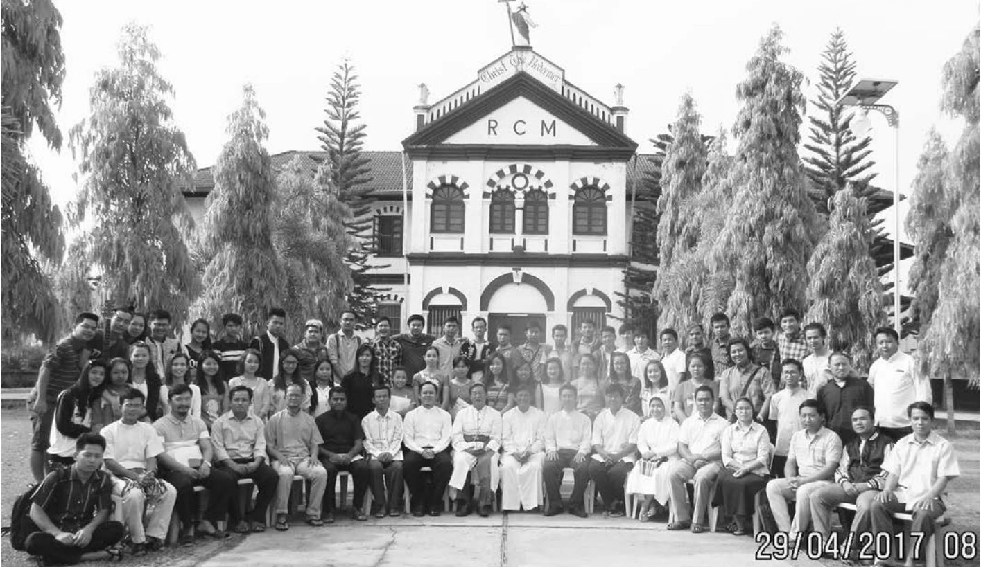
လူငယ်ကော်မရှင်ရုံး

တတိယနေ့တွင် Organization Planning System (3) ကို တစ်နေ့တာလုံး ဆက်လက် သင်ကြားပို့ချခဲ့သည်။ ညနေပိုင်းတွင် ကျိုင်းတုံဆရာတော်မှ တည်ခင်းကျေးမွေးညွှန်သော ညစာကို အတူတကွ သုံးဆောင်ခဲ့ကြသည်။ ထို့နောက် ည အစီအစဉ်တွင် သင်တန်းဆင်းလက်မှတ် ပေးအပ်ခြင်း၊ နောက်လာမည့် လူငယ်တာဝန်ခံ အစည်းအဝေးကို လားရှိုး သာသနာတွင် ဆက်လက်ပြုလုပ်သွားမည်ကို အတည်ပြုဆုံးဖြတ်ခဲ့ကြသည်။