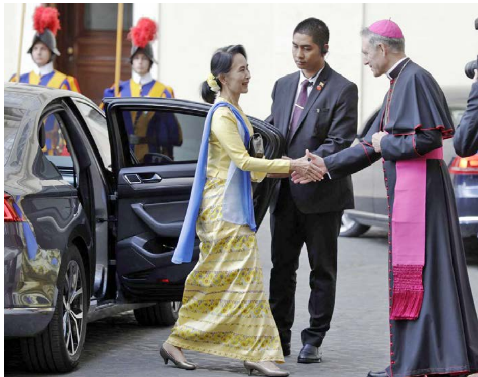
နိုင်ငံတော်၏ အတိုင်ပင်ခံ ရောက်ရှိစဉ် တာဝန်ခံ မွန်ဆီညော်မှ ခရီးဦးကြိုပြုခြင်း

တွေ့ဆုံအပြီး နှုတ်ဆက်ရာတွင် "ကျွန်ုပ်အတွက် ဆုတောင်းပေးပါ။" "သင့်ကို ကျွန်ုပ်၏ ဆုတောင်းမေတ္တာများတွင် အစဉ်သတိရပါမယ်။ ကျေးဇူးတင်ပါတယ်" ဆိုသည့် စာတန်းများကို ဗီဒီယိုဖိုင်တွင် ထိုးထားသည်ကို တွေ့ရသည်။ နိုင်ငံတော်၏ အတိုင်ပင်ခံပုဂ္ဂိုလ်သည် လက်ဆွဲနှုတ်ဆက်