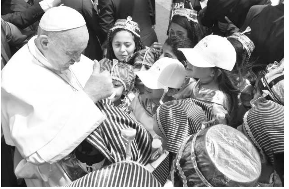
ရဟန်းမင်းကြီးသည် လူငယ်များနှင့်လည်း သီးခြားတွေ့ဆုံခဲ့ပြီး ရင်းနှီးစွာဝေမျှခဲ့သည်။

မေလ ၁၀ ရက်နေ့တွင် ကော့ပံတစ်ခရစ်ယာန် ရဟန်းမင်းထံသို့ အီဂျစ်ပြည်တွင် ရှိစဉ်အခါ ဧည့်ဝတ်ပြုခဲ့သည်များအတွက် ကျေးဇူးတင်စာ တစ်စောင်ပို့ခဲ့သည်။