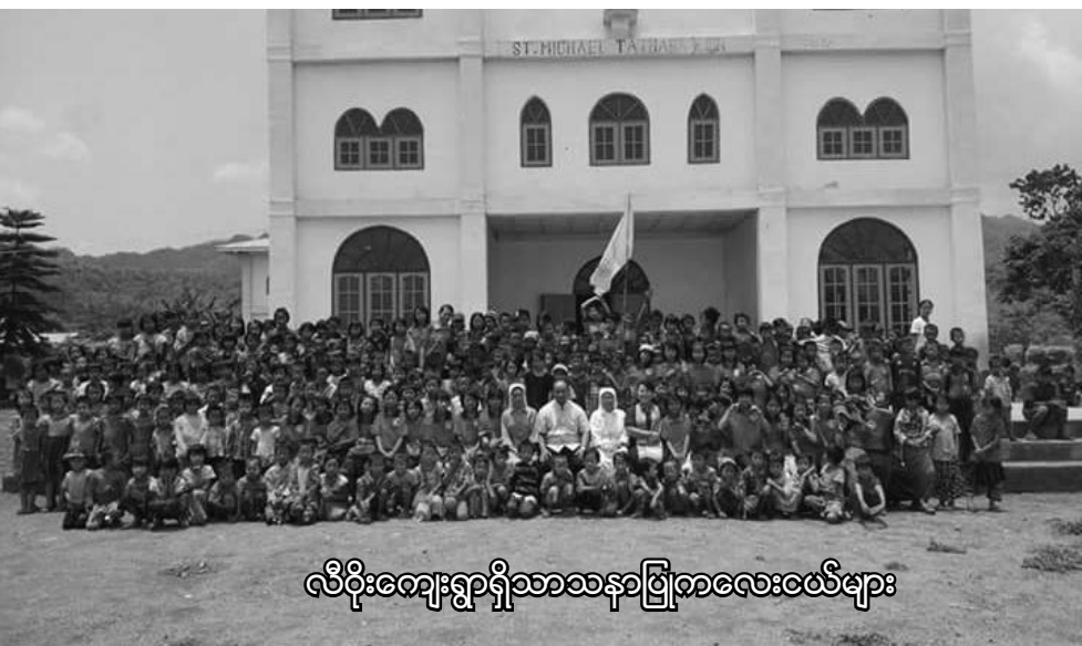
လိပိုးကျေးရွာရှိသာသနာပြုကလေးငယ်များ

လွိုင်ကော် ဂိုဏ်းအုပ် သာသနာ လုံးဆိုင်ရာ ဒုတိယအကြိမ်မြောက် သာသနာပြုကလေးသူငယ်များ နီးနှောဖလှယ်ပွဲကို မေလ (၄) ရက်မှ (၈) ရက်နေ့ အထိ လွိုင် ကော် သာသနာ ဒေါင်ခါး တိုက်နယ်တွင် ပြုလုပ်ကျင်းပခဲ့ပါသည်။ နီးနှောဖလှယ်ပွဲသို့