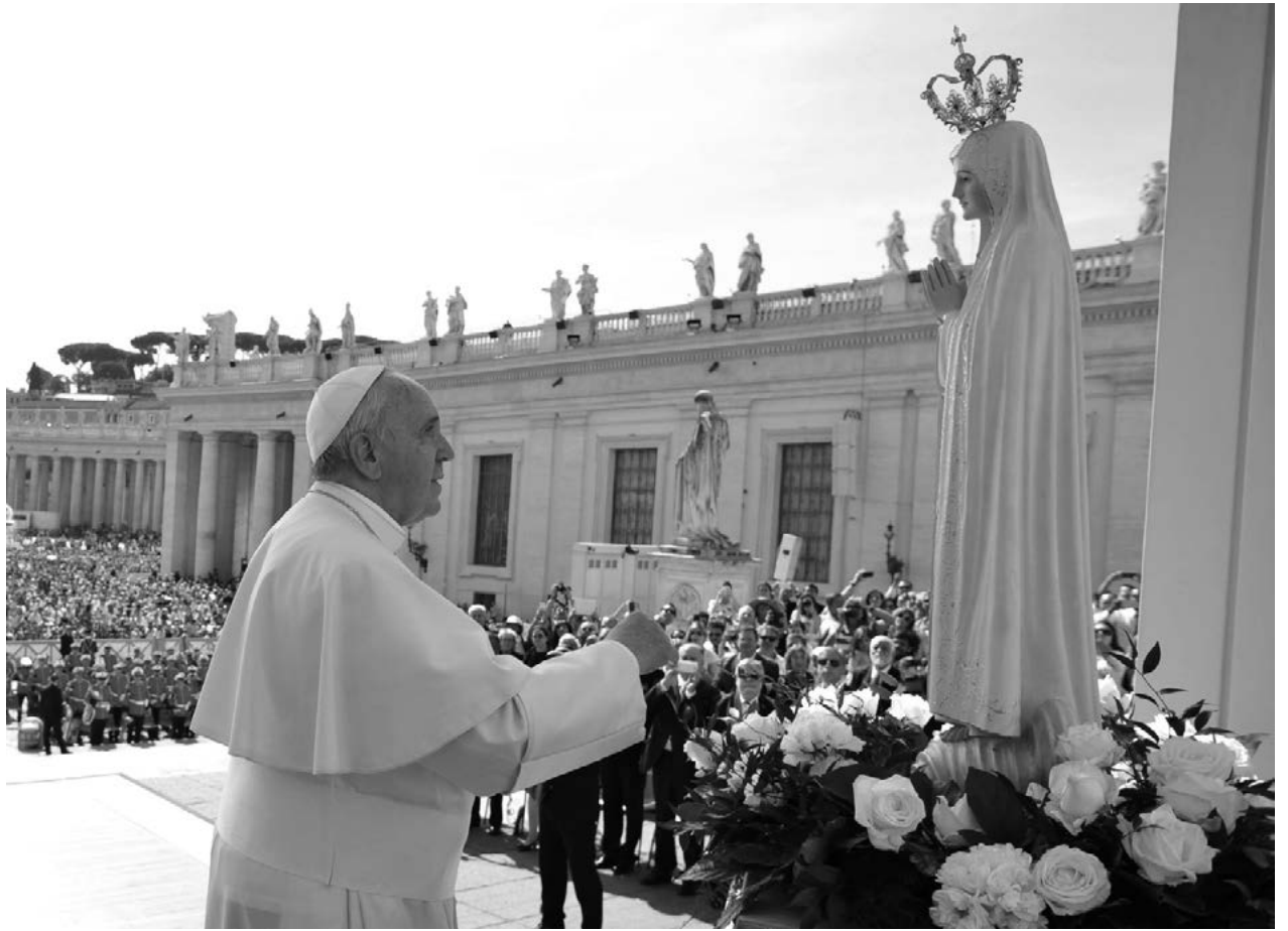
လျှောက်လှမ်းနိုင်ဖို့၊ နောက်ဆုံးကျွန်တော်တို့နဲ့လုံးသားထဲ မှာလည်း ငြိမ်သက်ခြင်းတွေ ရှိလာဖို့အတွက် အတူတကွ ဆုတောင်းပေးကြရအောင်လား။ စိပ်ပုတီးစိပ်ခြင်းအားဖြင့် အမိမယ်တော်ရဲ့ ကူညီမှုင်းမမှုတွေ အမြဲခံစားရရှိကာ

ပုပ်ရဟန်းမင်းကြီးရဲ့ မိန့်ကြားစကားအတိုင်း စိပ် ပုတီး စိပ်တယ်ဆိုတာ အခက်အခဲတွေကြားမှာ ရှင်သန်ရပ် တည်ရဲတဲ့ အစွမ်းသတ္တိတွေကို တောင်းလျှောက်ကြရမယ် ဆိုတာကို သတိရအောက်မေ့ရင်း ကမ္ဘာကြီးငြိမ်းချမ်းဖို့ မြန်မာပြည်ကြီး ငြိမ်းချမ်း သာယာစေဖို့ မိသားစုဘဝတွေ အေးချမ်းစွာ ပေါင်းစည်းရှင်သန်ဖို့ နာကျင်ခံစားရတဲ့ ဝေဒနာ တွေကြားမှာ စိတ်ဓါတ်ကျအရုံးမပေးဘဲ ဘဝကိုစိန်ခေါ်