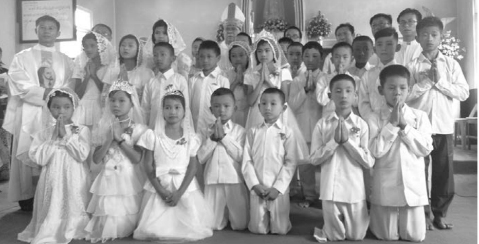
မြန်မာနိုင်ငံ ကက်သလစ်ဆရာတော်များ အဖွဲ့ချုပ်၊ လူထုဆက်သွယ်ရေးရုံး