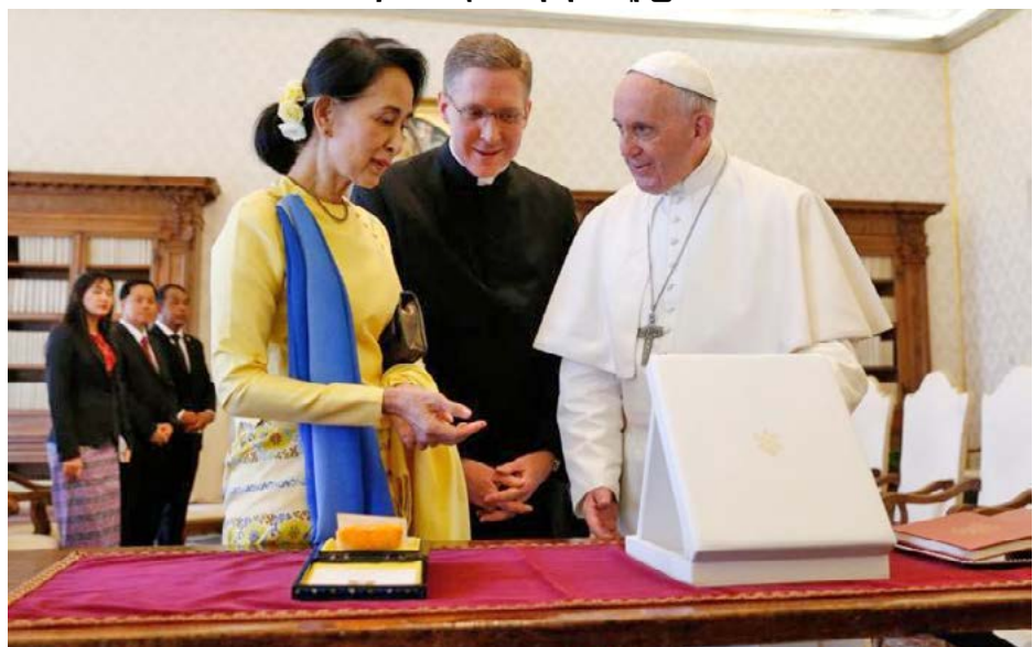
အမှတ်တရ လက်ဆောင်များ လဲလှယ်ကြစဉ်

The Holy See and the Republic of the Union of Myanmar, keen to promote bonds of mutual friendship, have jointly agreed to establish diplomatic relations at the level of Apostolic Nunciature, on behalf of the Holy See, and Embassy, on the part of the Republic of the Union of Myanmar.