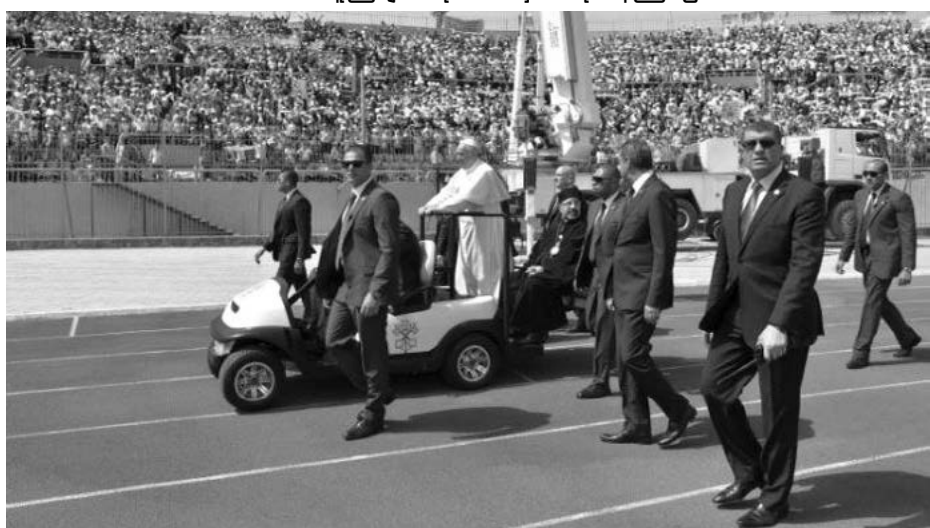
မစ္စားဟောမည့် ကစားကွင်းအတွင်း လှည့်လည်ကာ လူထုကို နှုတ်ဆက်ခဲ့သည်။