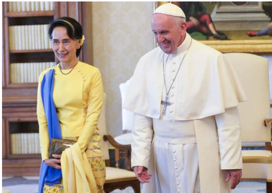
အမှတ်တရ ဓါတ်ပုံ ရိုက်ကူးခြင်း